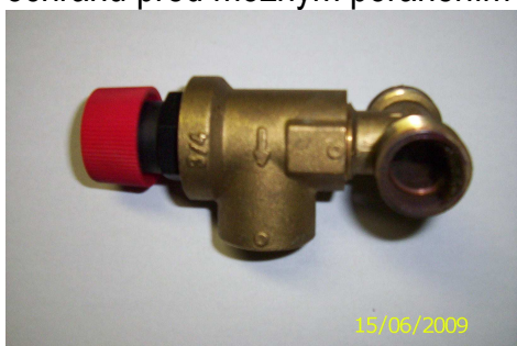
Obrázek č. 5 Pojist'ovací ventil

5.5. Pojist'ovací ventil – bezpečnostní prvek sloužící pro ochranu systému před přetlakováním a ochranu před možným poraněním obsluhy ( viz obrázek č 5).