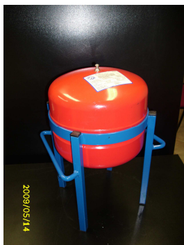
Obrázek č.8 Expanzní nádoba

5.9. Odvzdušňovací ventil – zařízení sloužící k vyloučení uvolněných plynů z topného systému ( viz obrázek č.9 )