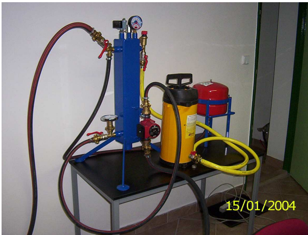
Obrázek 18 Externí zdroj tepla

7.2.3.3. Pak již stačí vytvořit okruh ve kterém je zapojena netěsná část systému a provést zatěsnění běžným postupem podle článku 7.2.1.