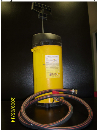
Obrázek č 1 Tlaková nádoba

5.1. Tlaková nádoba - válcová nádoba s ruční pumpou, vybavená z důvodu bezpečnosti pojistkovacím ventilem , nastaveným z výroby na cca 6 barů (viz obrázek č 1)