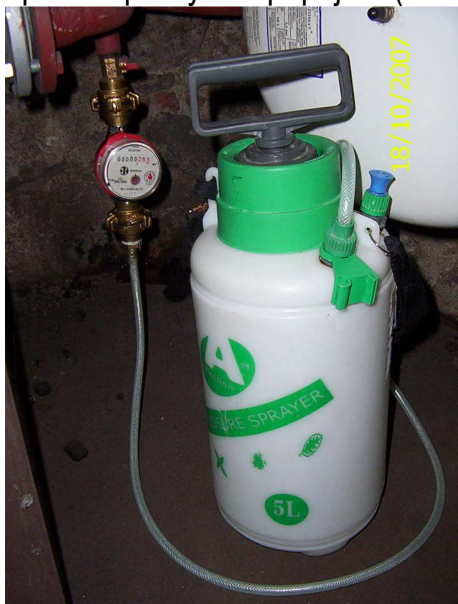
Obrázek č.15 Zapojení pro stanovení velikosti úniku média

6.1.1. Na bajonetovou rychlospojku na vypouštěcím kohoutu kotle se připojí bytový vodoměr s bajonetovými rychlospojkami a tlaková nádoba (lze použít např. zahradní postřikovač, který je opět upraven pro rychlé připojení (obrázek č. 15) s vodou.