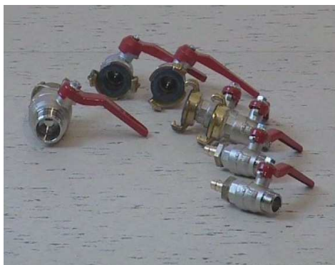
Obrázek č.12 Uzavírací kulové kohouty

5.13. pH - papírky viz obrázek č.14 nebo