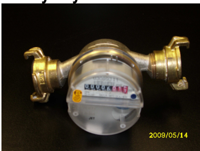
Obrázek č. 3 Bytový vodoměr s bajonetovými koncovkami

5.3. Bytový vodoměr – vrtulkový objemový měřič kapaliny (viz obrázek č. 3)