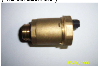
Obrázek č.9 Odvzdušňovací ventil

5.9. Odvzdušňovací ventil – zařízení sloužící k vyloučení uvolněných plynů z topného systému ( viz obrázek č.9 )