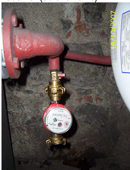
Obrázek č. 16 Stanovení obsahu systému vypuštěním přes bytový vodoměr

6.2.3. Stanovení obsahu systému vypuštěním celého systému v nejnižším místě přes bytový vodoměr (obrázek č. 16).