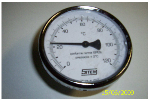
Obrázek č. 4 Teploměr

5.5. Pojist'ovací ventil – bezpečnostní prvek sloužící pro ochranu systému před přetlakováním a ochranu před možným poraněním obsluhy ( viz obrázek č 5).