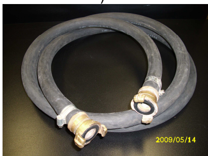
Obrázek č.10 Propojovací hadice s bajonetovými rychlospojkami

5.10. Propojovací hadice - zařízení sloužící k propojení externích zařízení topného systému (viz obrázek č. 10 )