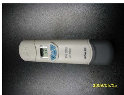
Obrázek č. 13 Elektronický pH - metr

5.14. pH – metr viz obrázek č.13 – prostředky pro stanovení kyselosti, nebo zásaditosti topné vody sloužící pro kontrolu koncentrace zatěšňovacího systému, případně pro kontrolu, zda byl systém po zatěsnění dostatečně vypláchnut.