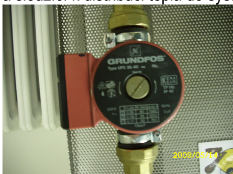
Obrázek č. 7 Oběhové čerpadlo

5.7. Oběhové čerpadlo - zařízení pro zajištění cirkulace topného média bránící lokálnímu přehřátí a sloužící k distribuci tepla do systému topení ( viz obrázek č.7 )