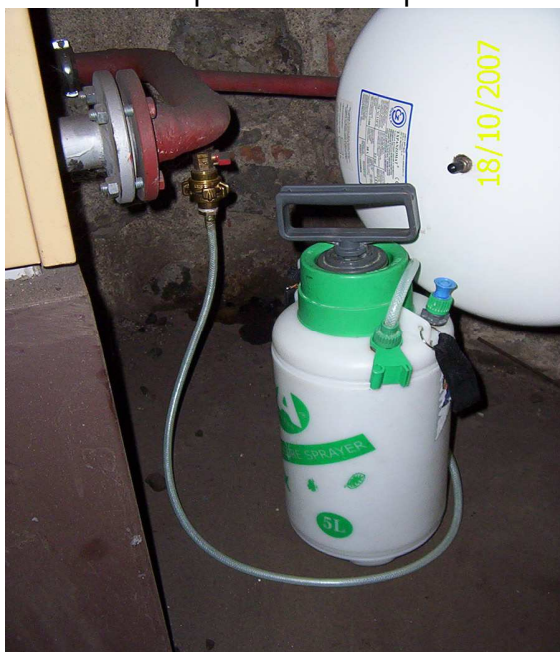
Obrázek č. 18 Plnění kapaliny do systému

7.2.1.5. Po uzavření tlakové nádoby a otevření vypouštěcího kohoutu se přetlačí kapalina tlakem vzduchového polštáře nad kapalinou do systému (obr. 18).