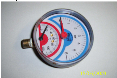
Obrázek č. 2 Termomanometr

5.2. Manometr – ( termomanometr) zařízení pro měření tlaku s rozsahem do 6 barů ( viz obrázek č. 2)