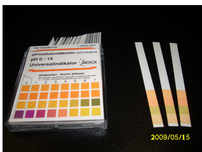
Obrázek č.14 pH - papírky