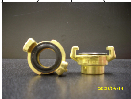
Obrázek č. 11 Bajonetové rychlospojky

5.11. Bajonetové rychlospojky různých dimenzí - zařízení sloužící k rychlému propojení jednotlivých komponent ( viz obrázek č.11)